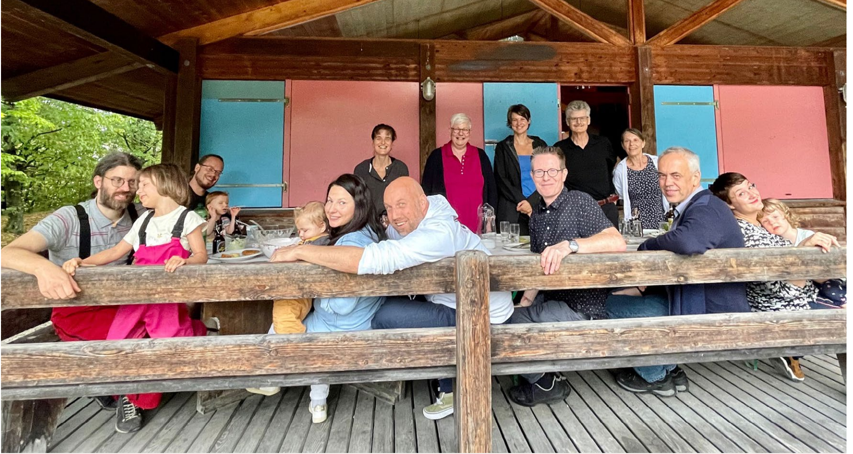
Team-Event im Freizeithaus Rütiwäldli in Ittigen.