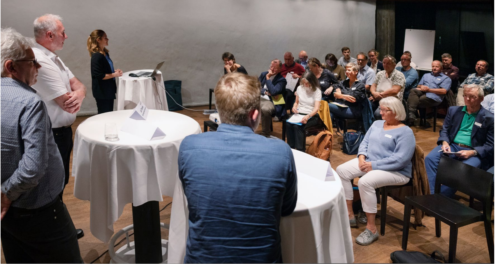
Wissensplattform Innenentwicklung: Erfahrungsaustausch am 20. Oktober in Bern.