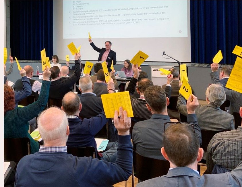
Die Regionalversammlung tagte am 15. Dezember im Bärensaal in Worb.